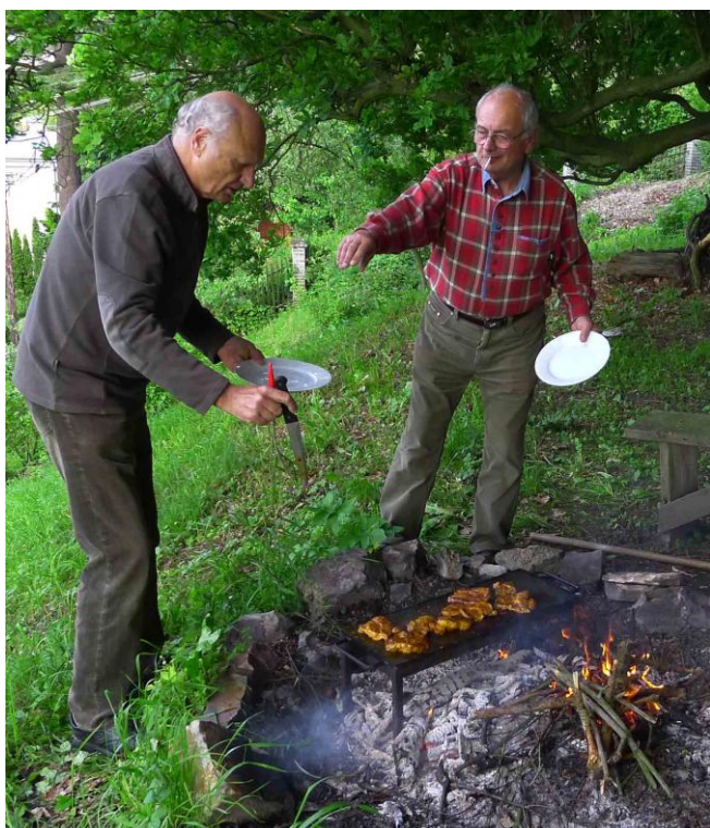
Vždy pracující Pegas