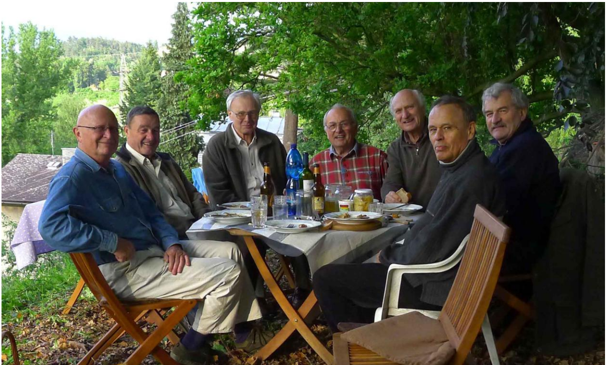
... a hosté